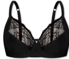
24395 | Bügel-BH / wire bra / SG avec armatures B-E | 75-95