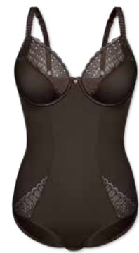
989 | Body B-D | 75-95

Cup Material / coupe le matériel: 90% Polyester 10% Elasthan / elastane / élasthanne