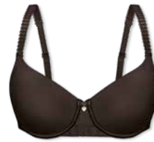
24788 | Schalen-BH / padded bra / SG paddé B-D | 75-95