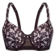
24390 | Schalen-BH / padded bra / SG paddé B-E | 75-95