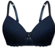
24349 | Schalen-BH / padded bra / SG paddé B-D | 75-95