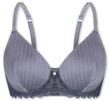
24392 | Schalen-BH / padded bra / SG paddé B-E | 75-95