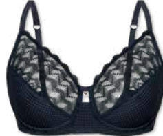
24350 | Bügel-BH / wire bra / SG avec armatures B-E | 75-95