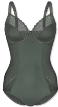
989 | Body B-D | 75-95