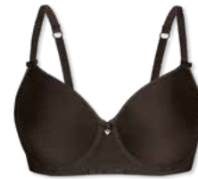
25790 | Spacer-BH / spacer bra / SG spacer B-E | 75-95 FLEXICUP

Grundware / main material / matériel de base: 85% Polyamid / polyamide 15% Elasthan / elastane / élasthanne