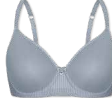
24394 | Spacer-BH / spacer bra / SG spacer B-E | 75-95 FLEXICUP Cup Material / coupe le matériel: 90% Polyamid / polyamide 10% Elasthan / elastane / élasthanne