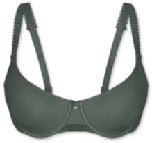
24788 | Schalen-BH / padded bra / SG paddé B-D | 75-95