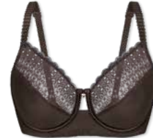
24790 | Bügel-BH / wire bra / SG avec armatures B-F | 75-100