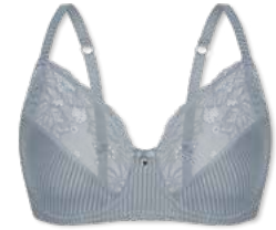
24395 | Bügel-BH / wire bra / SG avec armatures B-E | 75-95