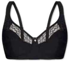
14394 | Soft-BH / soft cup bra / SG sans armatures B-E | 75-95