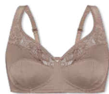
14375 | Soft-BH / soft cup bra / SG sans armatures B-E | 75-95