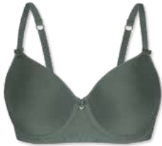
25790 | Spacer-BH / spacer bra / SG spacer B-E | 75-95 FLEXICUP

Grundware / main material / matériel de base: