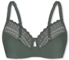
24790 | Bügel-BH / wire bra / SG avec armatures B-F | 75-100