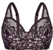
24391 | Bügel-BH / wire bra / SG avec armature B-F | 75-95