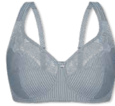
14394 | Soft-BH / soft cup bra / SG sans armatures B-E | 75-95