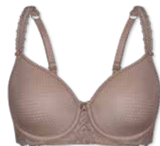
24375 | Spacer-BH / spacer bra / SG spacer B-E | 75-95 FLEXICUP