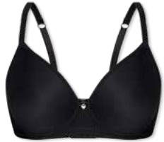
24394 | Spacer-BH / spacer bra / SG spacer B-E | 75-95 FLEXICUP

Cup Material / coupe le matériel: 90% Polyamid / polyamide 10% Elasthan / elastane / élasthanne