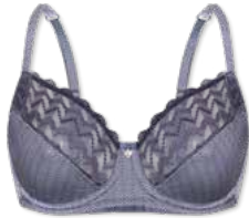
24393 | Bügel-BH / wire bra / SG avec armatures B-F | 75-95