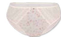
44422 | Slip / brief 38-48