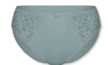
44420 | Slip / brief 38-48