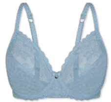
24417 | Bügel-BH / wire bra / SG avec armatures B-E | 75-95

Cup Material / coupe le matériel: 90% Polyester 10% Elasthan / elastane / élasthanne