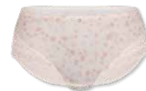
34422 | Panty / shorty 38-46