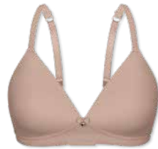
18358 | Soft-BH Einlage/ padded soft cup bra / SG paddé sans armatures B-D | 75-95