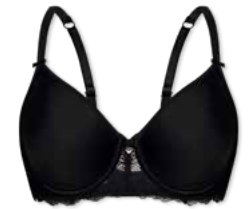
28358 | Spacer-BH / spacer bra / SG spacer B-E | 75-95 FLEXICUP Cup Material / coupe le matériel: 90% Polyester 10% Elasthan / elastane / élasthanne