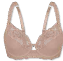
24376 | Bügel-BH / wire bra / SG avec armatures B-E | 75-95

Cup Material / coupe le matériel: 90% Polyester 10% Elasthan / elastane / élasthanne