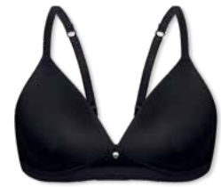
18358 | Soft-BH Einlage/ padded soft cup bra / SG paddé sans armatures B-D | 75-95