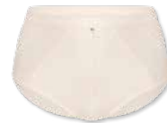
38358 | Panty / shorty 38-46