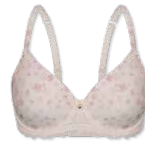
24422 | Schalen-BH / paddes bra / SG paddé B-D | 75-95