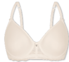
28358 | Spacer-BH / spacer bra / SG spacer B-E | 75-95 FLEXICUP Cup Material / coupe le matériel: 90% Polyester 10% Elasthan / elastane / élasthanne