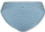
44416 | Slip / brief 38-48