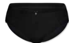
48358 | Slip / brief 38-48