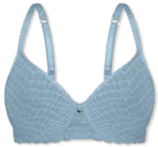
24416 | Spacer-BH / spacer bra / SG spacer B-D | 75-95 FLEXICUP

Cup Material / coupe le matériel: 90% Polyester 10% Elasthan / elastane / élasthanne