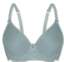
24420 | Spacer-BH / spacer bra / SG spacer B-E | 75-95 FLEXICUP Cup Material / coupe le matériel: 90% Polyester 10% Elasthan / elastane / élasthanne