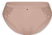
48358 | Slip / brief 38-48