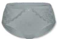
34349 | Panty / shorty 38-46