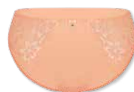
44418 | Slip / brief 38-48