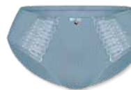
47889 | Slip / brief 38-48 90% Polyamid / polyamide 10% Elasthan / elastane / élasthanne

■ 724 steel blue NOS 100 white NOS 209 nude NOS 500 black