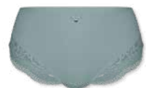
34420 | Panty / shorty 38-46