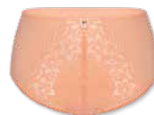
34418 | Panty / shorty 38-46