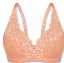
24419 | Schalen-BH / paddes bra / SG paddé B-E | 75-95