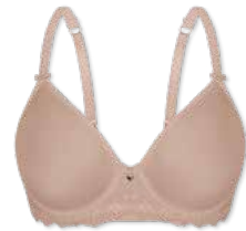
28358 | Spacer-BH / spacer bra / SG spacer B-E | 75-95 FLEXICUP Cup Material / coupe le matériel: 90% Polyester 10% Elasthan / elastane / élasthanne