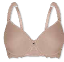
24375 | Spacer-BH / spacer bra / SG spacer B-E | 75-95 FLEXICUP

Cup Material / coupe le matériel: 90% Polyester 10% Elasthan / elastane / élasthanne