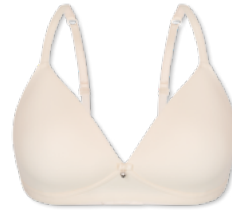
18358 | Soft-BH Einlage/ padded soft cup bra / SG paddé sans armatures B-D | 75-95