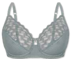
24350 | Bügel-BH / wire bra / SG avec armatures B-E | 75-95