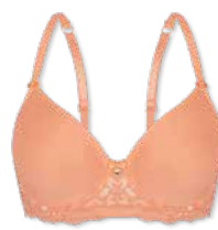
24418 | Spacer-BH / spacer bra / SG spacer B-E | 75-95 FLEXICUP Cup Material / coupe le matériel: 90% Polyester 10% Elasthan / elastane / élasthanne