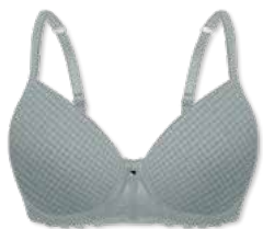
24349 | Schalen-BH / paddes bra / SG paddé B-D | 75-95