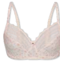
24423 | Bügel-BH / wire bra / SG avec armatures B-E | 75-95