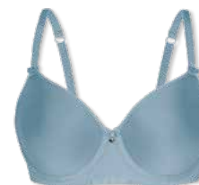
25790 | Spacer-BH / spacer bra / SG spacer B-E | 75-95 FLEXICUP Grundware / main material / matériel de base: 85% Polyamid / polyamide 15% Elasthan / elastane / élasthanne Cup Material / coupe le matériel: 90% Polyester 10% Elasthan / elastane / élasthanne