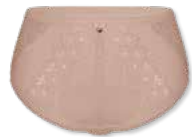
38358 | Panty / shorty 38-46