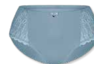
36089 | Panty / shorty 38-46 92% Polyamid / polyamide 8% Elasthan / elastane / élasthanne