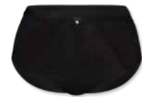
38358 | Panty / shorty 38-46