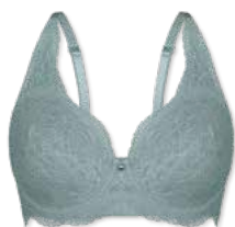
24421 | Bügel-BH / wire bra / SG avec armatures B-E | 75-95