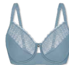
24790 | Bügel-BH / wire bra / SG avec armatures B-F | 75-100 90% Polyamid / polyamide 10% Elasthan / elastane / élasthanne