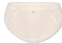
48358 | Slip / brief 38-48