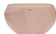
44375 | Slip / brief 38-48

■ 406 amaretti NOS 100 white NOS 314 ivory